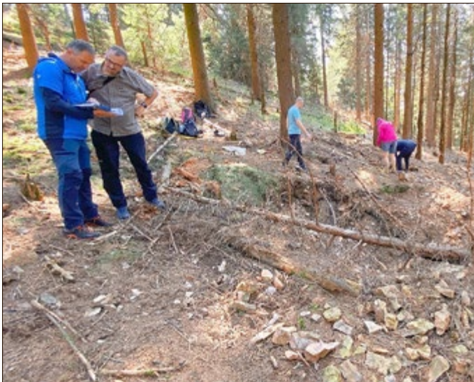
Noch heute, fast 60 Jahre nach den geheimen Untersuchungen an den Uranervorkommen, sind die Veränderungen an zahlreichen Stellen im Gelände deutlich sichtbar.

Die Untersuchungen sollten neue Informationen über den aktuellen Zustand des Gebiets liefern. Die Studierenden führten mittels verschiedener Analysetechniken geologische und geophysikalische Untersuchungen durch und kartierten u.a. auch die natürliche Radioaktivität im Gebiet. Außerdem wurde der Boden, die Vegetation und die Symbiose von Pilzen und Pflanzen (Mykorrhiza-Symbiose) um den Donnershauk sowie dessen natürliche Vererzung untersucht. Ein weiterer Aspekt betrachtete die Gewässerökologie in der näheren und weiteren Umgebung.