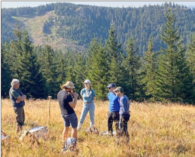
In Sichtweite der beiden Möstfelsen (im Hintergrund) untersuchten Studenten der Friedrich-Schiller-Universität aus Jena am Donnershauk die Langzeitfolgen von menschlichen Eingriffen in die Natur.

Die Untersuchungen sollten neue Informationen über den aktuellen Zustand des Gebiets liefern. Die Studierenden führten mittels verschiedener Analysetechniken geologische und geophysikalische Untersuchungen durch und kartierten u.a. auch die natürliche Radioaktivität im Gebiet. Außerdem wurde der Boden, die Vegetation und die Symbiose von Pilzen und Pflanzen (Mykorrhiza-Symbiose) um den Donnershauk sowie dessen natürliche Vererzung untersucht. Ein weiterer Aspekt betrachtete die Gewässerökologie in der näheren und weiteren Umgebung.