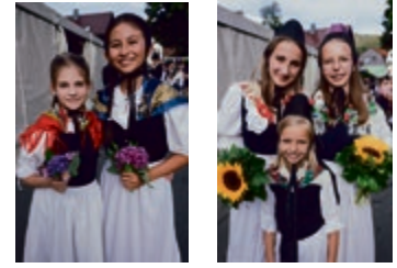
NACHWUCHS IN HISTORISCHER TRACHT