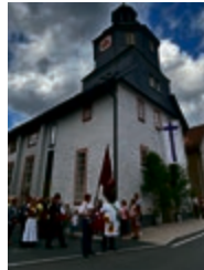
UMZUG DER VEREINE