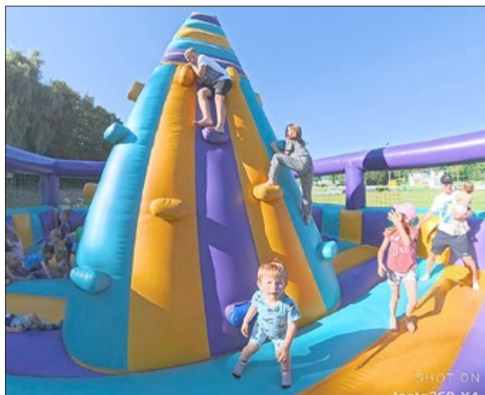
Spaß für Groß und Klein, Jung und Alt auf der Hüpfburg

Der Abend wurde bei gemütlichem Zusammensein beendet. Die Familienaktivnachmittage stärken den Zusammenhalt.