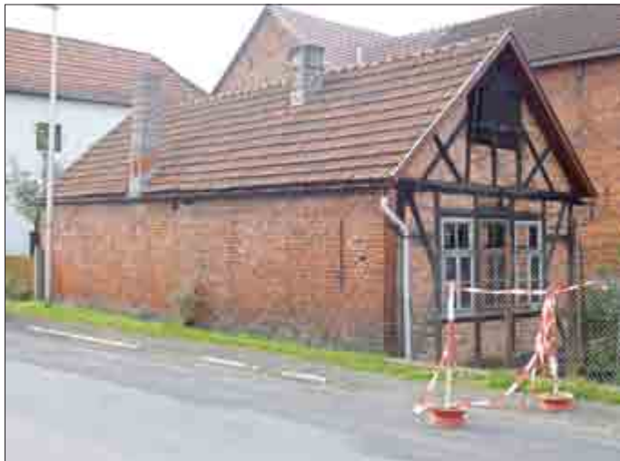
Feilenhauerei am alten Standort