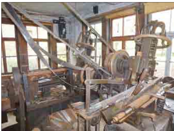
Innenraum der alten Werkstatt